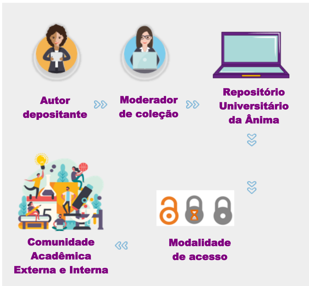
Figura 1- Macroprocesso do Repositório