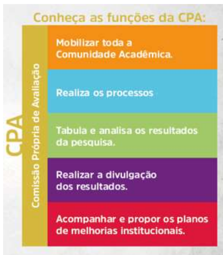
FIGURA 1- FUNÇÕES DA CPA