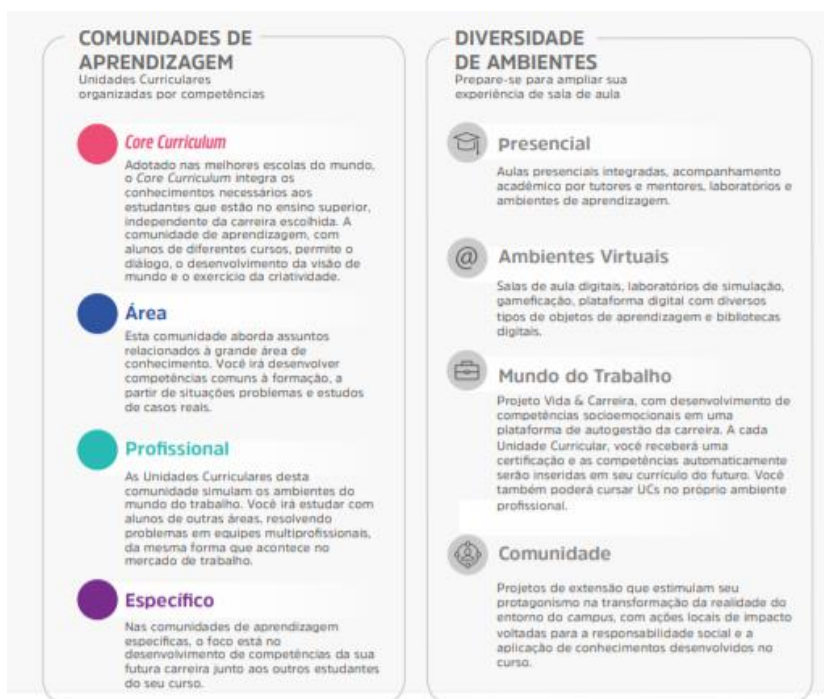
Figura 1 – Comunidades de aprendizagem e diversidade de ambientes

A flexibilidade do Currículo Integrado por Competências permite ao estudante transitar por diferentes comunidades de aprendizagem alinhadas aos seus respectivos eixos de formação. O percurso formativo é flexível, fluído, e ao final de cada unidade curricular o aluno atinge as competências de acordo com as metas de compreensão estudadas e vivenciadas ao longo do semestre.