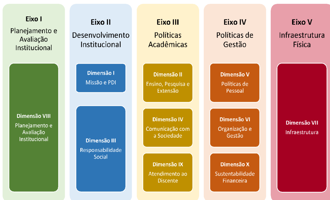
Figura 2 – Eixos e dimensões do SINAES

Essa autoavaliação, realizada em todos os cursos da IES, a cada semestre, de forma quantitativa e qualitativa, atenderá à Lei do Sistema Nacional de Avaliação da Educação Superior (SINAES), nº 10.8601, de 14 de abril de 2004. A legislação irá prever a avaliação de dez dimensões, agrupadas em 5 eixos, conforme ilustra a figura a seguir.